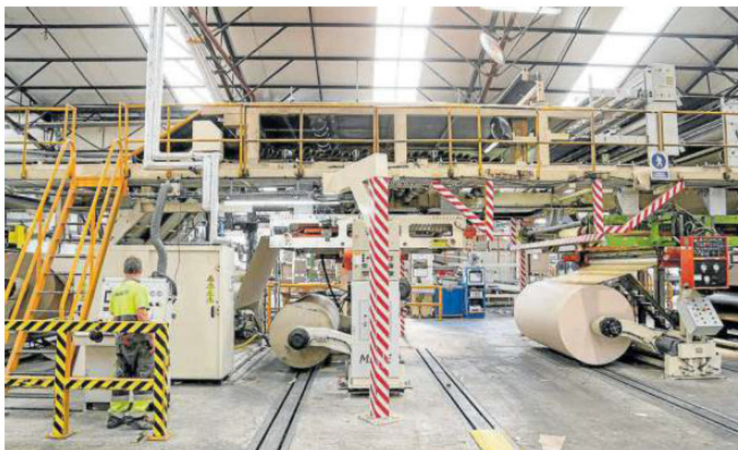
Instalaciones de Cartonajes Limousin en Tolosa.

Barrilero Legal Angels, división especializada en startups de la con-